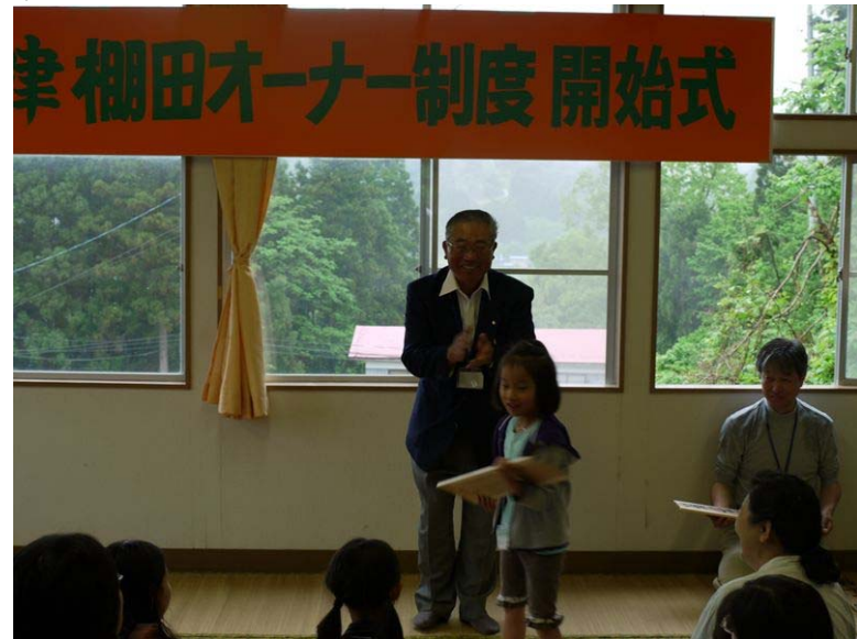
オーナー看板授与