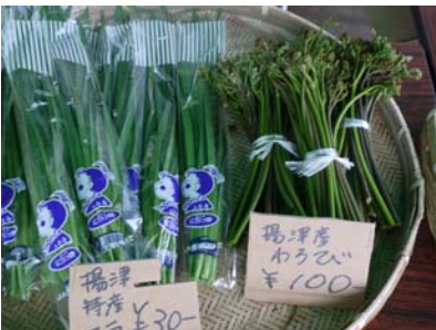
野菜直売も少しだけ