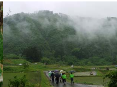
あいにくの雨で、けぶっていました