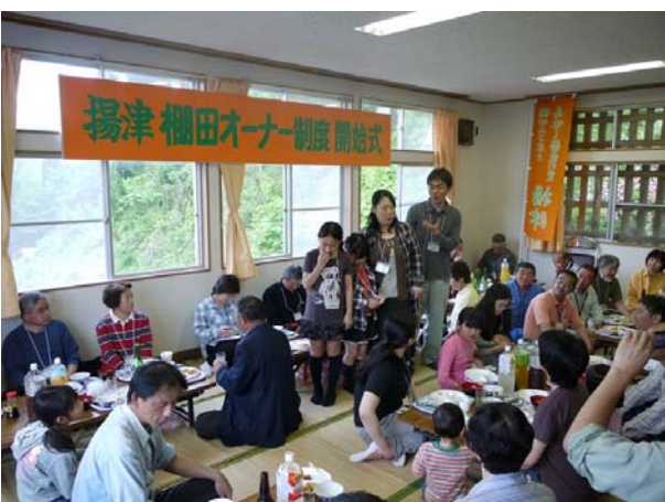
お昼ご飯は、揚津のお母ちゃんたちの手作り田舎料理。 山菜料理や、こしあぶらの天ぷらなど、