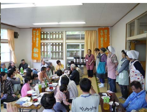
揚津のお母ちゃんたち